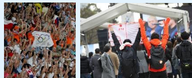
過去大会のライブサイト・競技会場での観戦の様子 (イメージ)