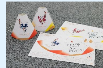
東京2020聖火リレー応援メガホン (イメージ)