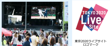
東京2020ライブサイト ロゴマーク