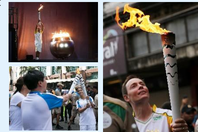
過去大会の聖火リレーの様子 (イメージ)