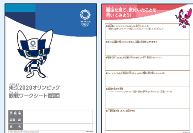
観戦ワークシート (イメージ)

観戦前に大会の見どころや競技のルール、注目選手、応援方法などを学んでみよう！東京2020では、 学校での事前・事後学習にご活用いただける資料等を配布 しています。