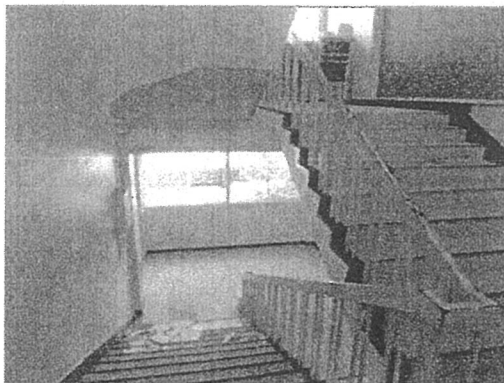
天井（階段裏）モルタルが落下