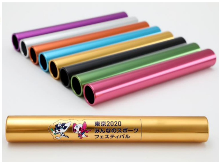
「特製リレーバトン」