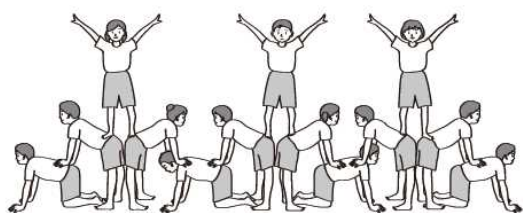
図4 横に広げる組立技の例①

普段から組体操のトレーニングを積んだ集団であれば話は別だが、運動会・体育祭で行う組体操のように、直前の限られた時間でしか練習できない学校現場の場合、高さを求める組立技は避けるべきである。安全を重視した組立体操は補助者の手の届く高さで実施するべきであり（図2、3）、特に小学校において3段以上のタワーを実施することは避けた方がよい。では高さを求めず横に広げる方法にシフトチェンジしてみてもはどうだろうか。図4、5のように意外と迫力のある組立技となり、また人数が多くなればなるほど全体でタイミングを合わせることも難しく、完成させることが難しくなる。高さを追求しなくても、十分に達成感を感じることができるはずである。