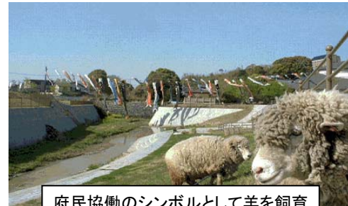
府民協働のシンボルとして羊を飼育