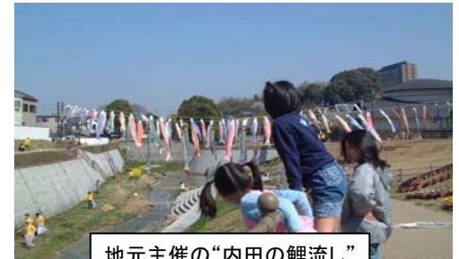
地元主催の“内田の鯉流し”