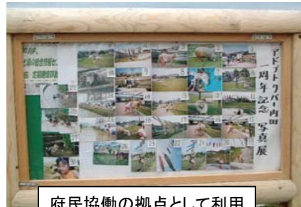
府民協働の拠点として利用