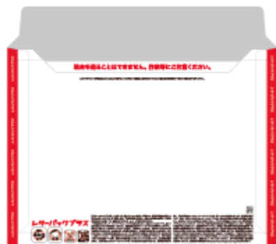
商品イメージ裏面