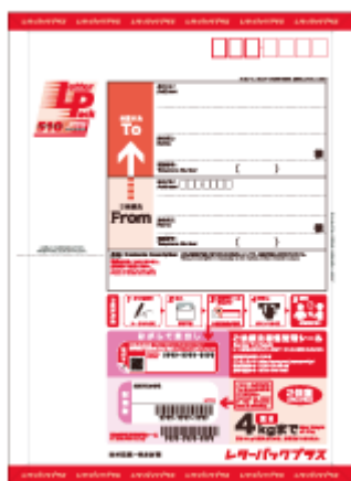
商品イメージ表面