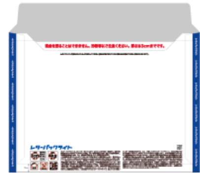
商品イメージ裏面