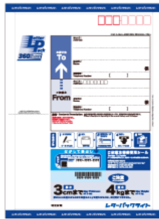
商品イメージ表面