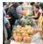
地産地消イベント