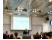
ヘルシー-外食フォーラムの審査員長を務める