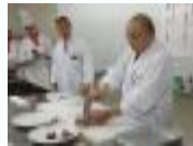
長年にわたりふぐ処理講習会の講師を務める