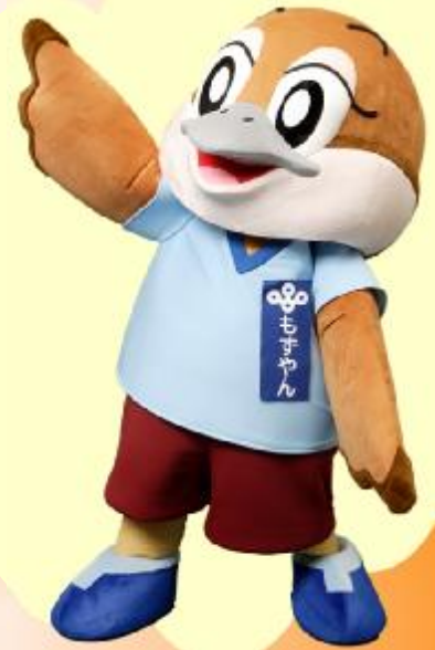
大阪府広報担当副知事 もずちゃん