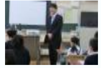
小学校での食育活動