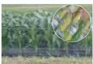
「能勢町観光物産センターブランド野菜」スイートコーン栽培ほ場