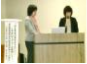
大阪府栄養士会研究発表会