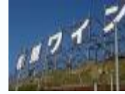
「カタシモワイナリー」