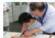
幅広い年代を対象とした料理講習会