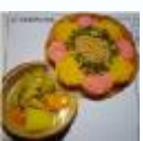
地域の高校と保健所が実施したメニューコンテスト入賞作品の商品化