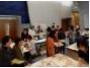
地域住民に対する栄養相談（泉佐野市健康フェスタ）