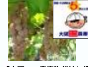
「大阪エコ農産物栽培ほ場」の認証取得