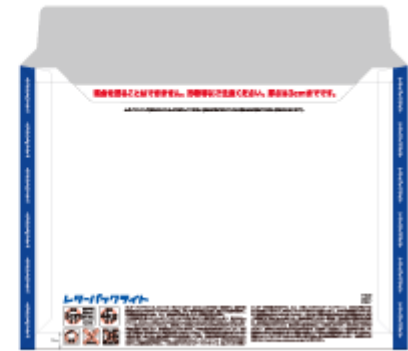
商品イメージ裏面