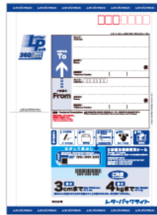
商品イメージ表面