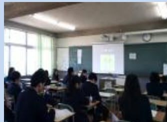
30 分授業の風景（西成）