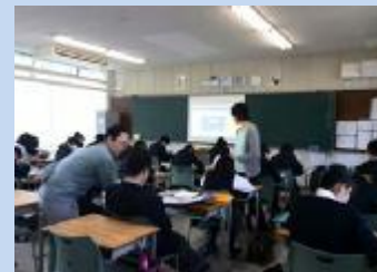
30 分授業の風景（箕面東）