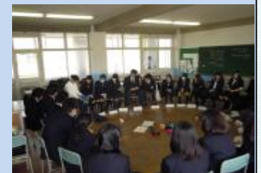
エンパワメントタイムの風景（長吉）