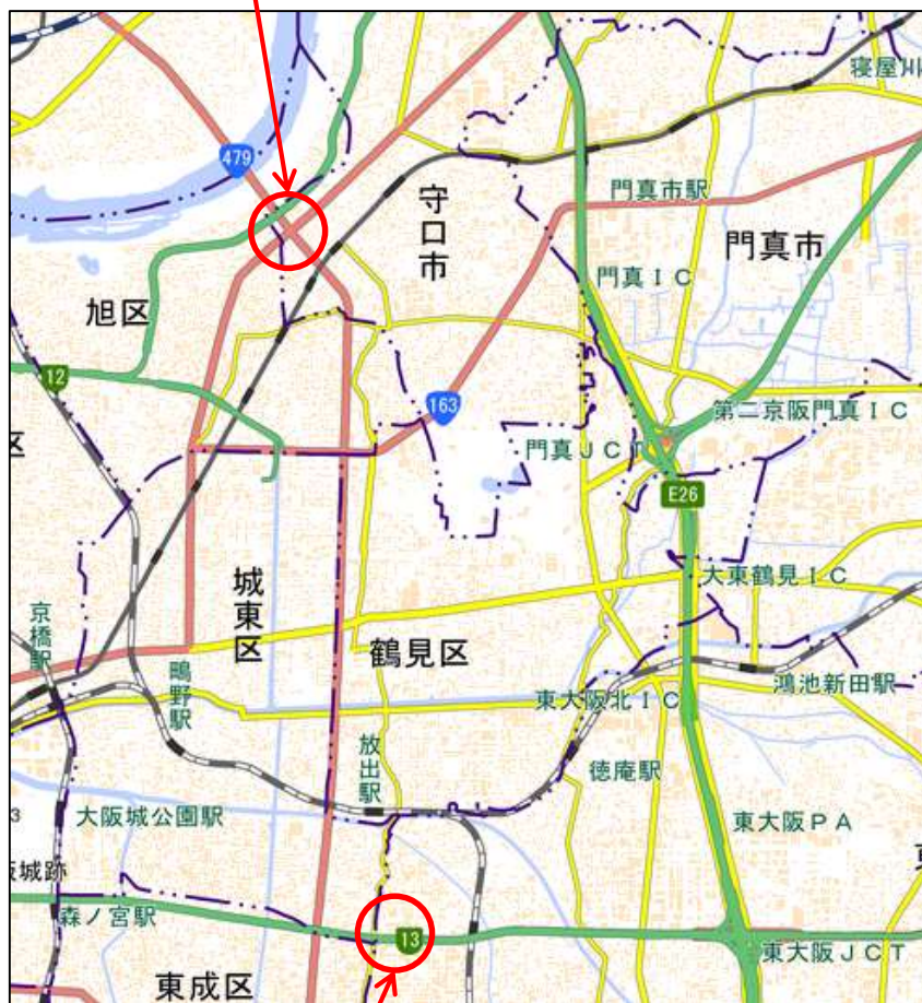
京阪本通1丁目交差点