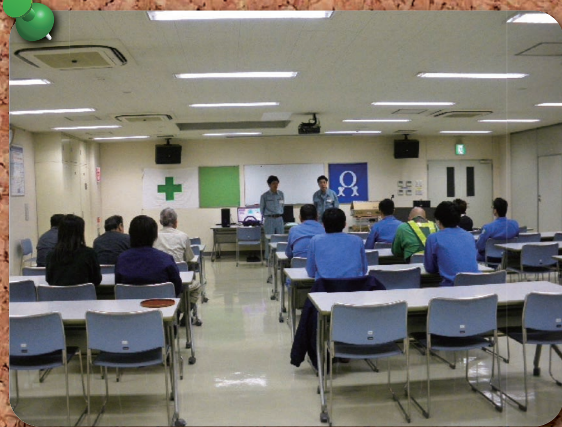
エコドライブ講習会