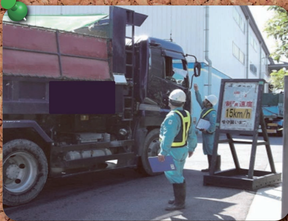
搬入されるお客様の車両に対してもエコドライブのチラシを配布。