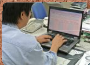
推進委員が各ドライバーに対し毎月コメントを記入