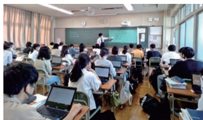
府立夕陽丘高等学校