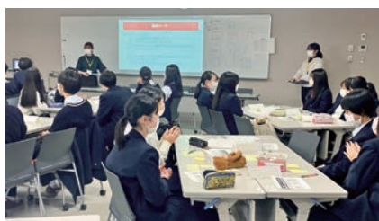
府立吹田東高等学校