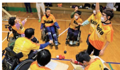
府立光陽支援学校