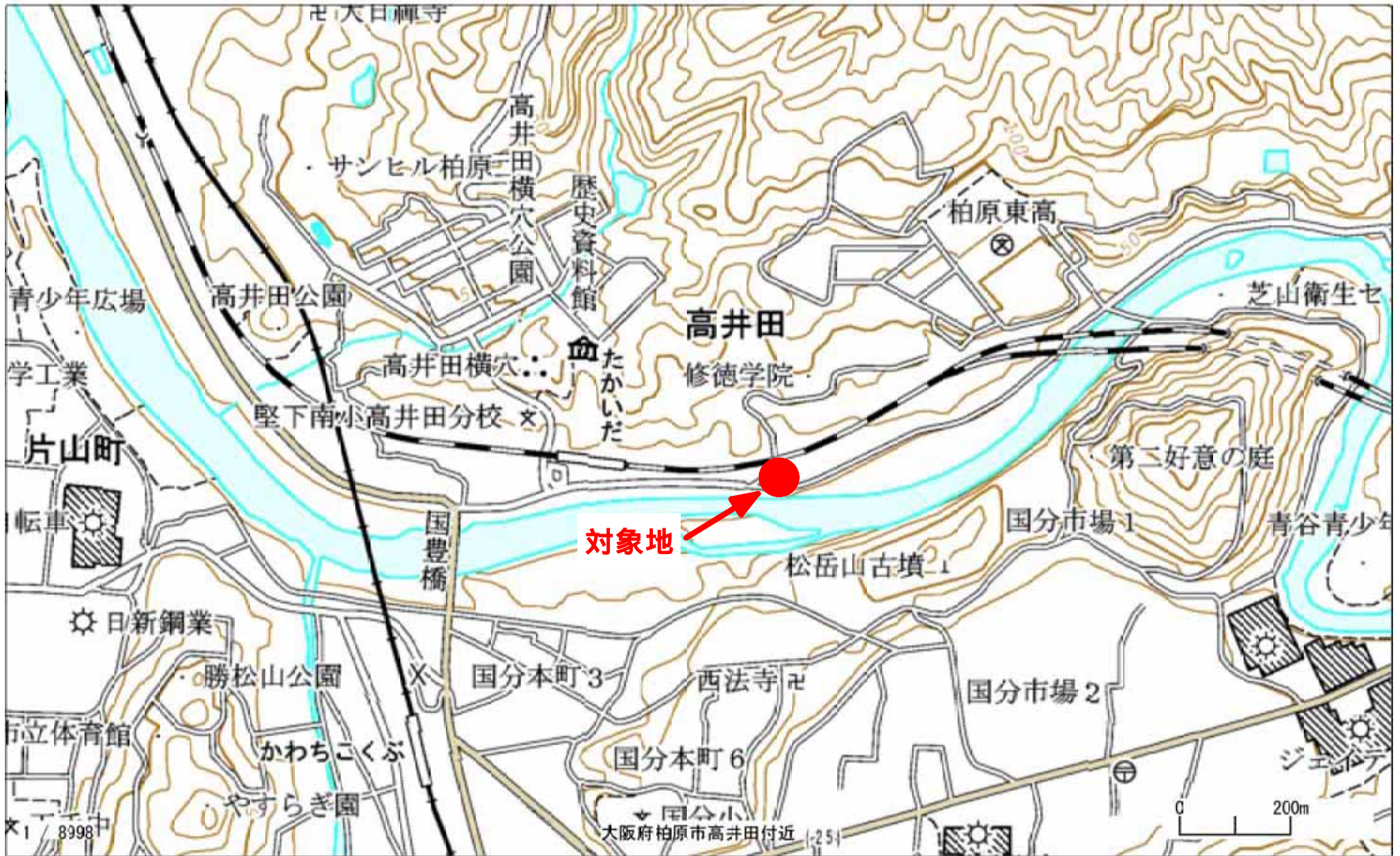
指定区域位置図(柏原市大字高井田894番1、894番6の各一部)