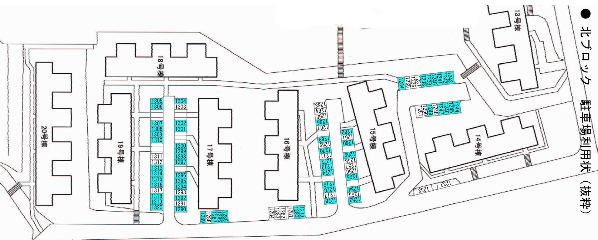
添付図 1 3 駐車場利用状況図 S=1: 1000 (A3)