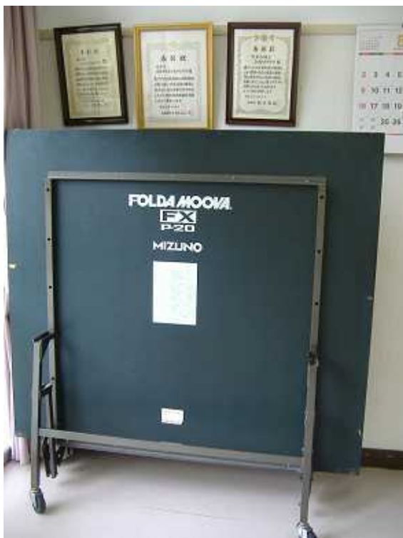
写真 2 6 集会室 卓球台