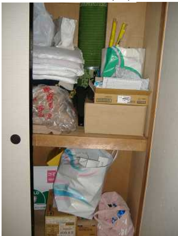
写真7 和室2 物入れ(3)