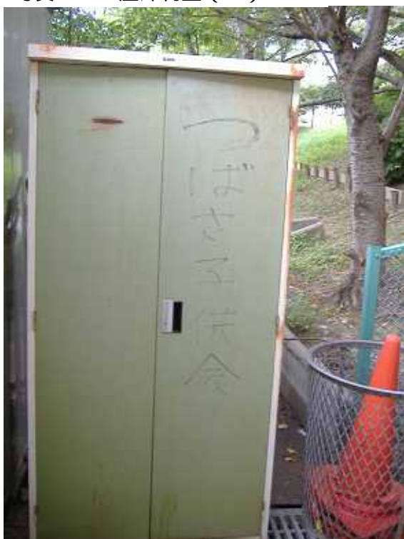
写真3 3 屋外物置(3)