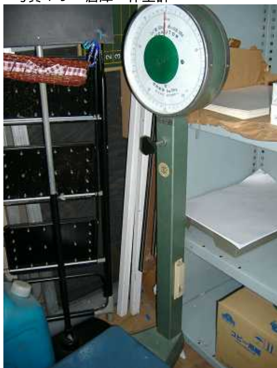
写真19 倉庫 体重計