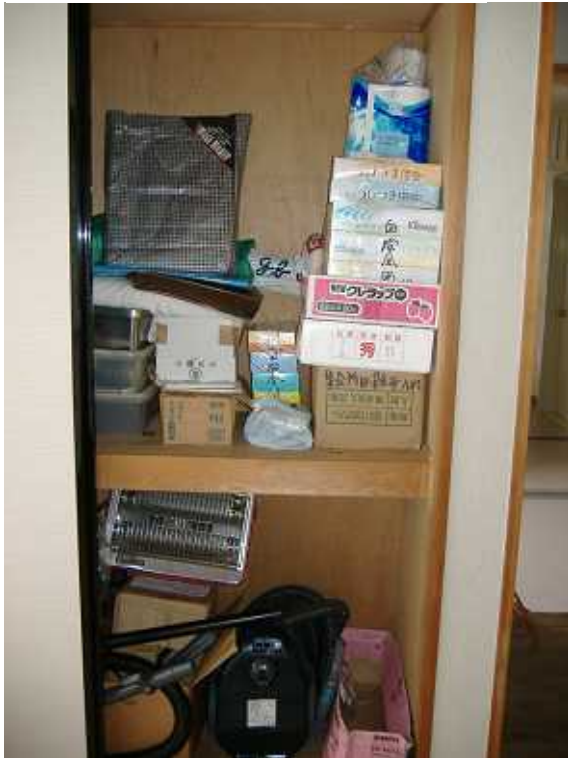
写真1 和室1 物入れ(1)