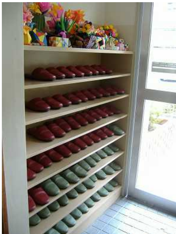
写真9 玄関 靴入れ