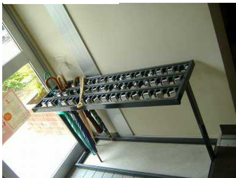
写真10 玄関 傘立て