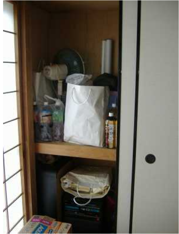
写真2 和室1 物入れ(2)