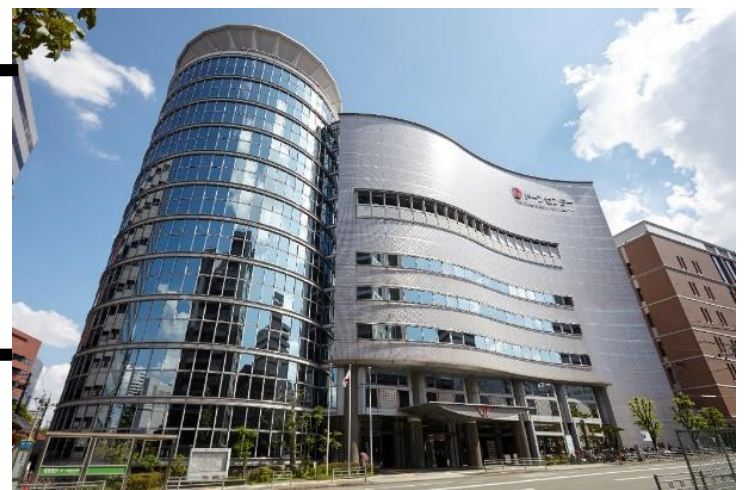
大阪府立男女共同参画・青少年センター (ドーンセンター)