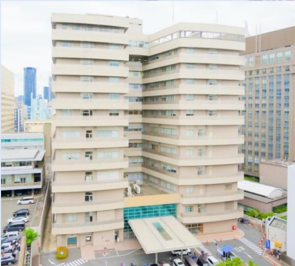
大手前病院※公式サイトより

周辺には、CITY MALLやOMMビルなどの商業施設、大阪府庁本館・別館、大手前病院、大阪歯科大学病院、テレビ大阪、追手門学院などの各種施設、大阪城が立地しており、様々な方からの来店が見込めます!