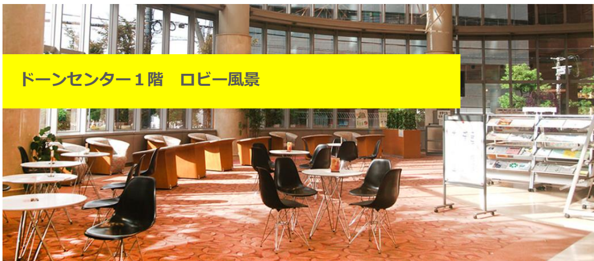
ドーンセンター1階 ロビー風景