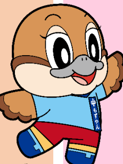
大阪府広報担当副知事 もずやん