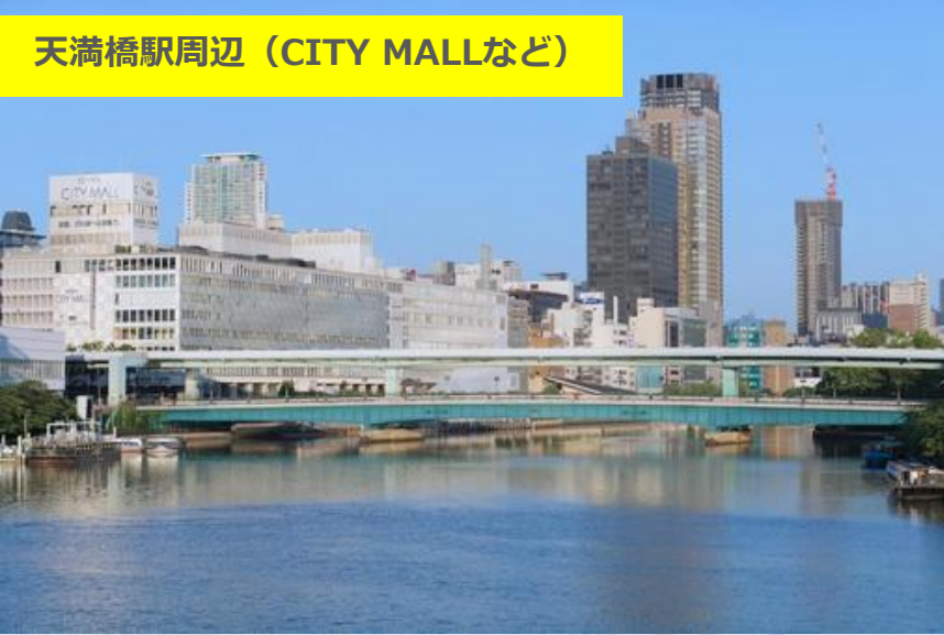
天満橋駅周辺 (CITY MALLなど)