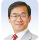
公明 三宅 史明 (大阪市東淀川区)

A 28年春新駅開業と1.5期開発の実現とともに、地区全体の広域拠点化に取り組む。