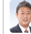
自保 うらべ 走馬 (茨木市)

A 耐震性能がない既存施設の対応が最優先。将来の土地利用は、中長期的な課題と認識。