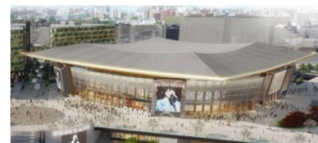
▲アリーナ(イメージ) 事業予定者決定時の提案イメージ (令和3年5月19日時点)