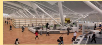
▲KIX 保安検査場等のイメージ