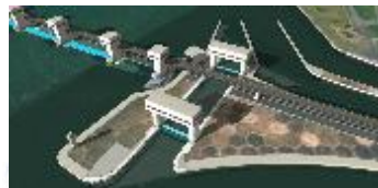
▲淀川大堰閘門完成イメージ