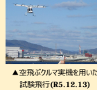
▲空飛ぶクルマ実機を用いた試験飛行(R5.12.13)

■会場内の遊覧・観覧体験や会場外ポートとの2地点間運航を実現 《国への提案・要望》 ▶万博における商用運航の実現