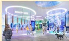
▲ミライのヘルスケア体験 (出典)大阪パビリオン出展基本計画案

□次世代ヘルスケアサービスの拡大による住民の健康増進 《国への提案・要望》 ▶健康長寿社会の実現に向けた次世代ヘルスケアサービスの創出の促進