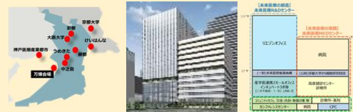
▲大阪・関西のライフサイエンス拠点等 ▲「未来医療国際拠点(名称:Nakanoshima Gross)」イメージ

▶万博で発信した最先端医療を国内外の患者に届けることで世界に貢献。そのために不可欠な再生医療の産業化に必要な支援