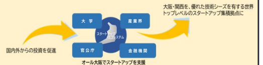
大阪・関西を、優れた技術シーズを有する世界トップレベルのスタートアップ集積拠点到

《国への提案・要望》 ▶万博での取組みを継承し、世界トップレベルのスタートアップ集積拠点を實現するため、スタートアップの創出・育成を強力に推進