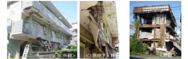
2階の廊下部分が崩落した事例 1階廊下天井 外壁が崩壊等した事例 全国の周辺へ悪影響を及ぼしている事例