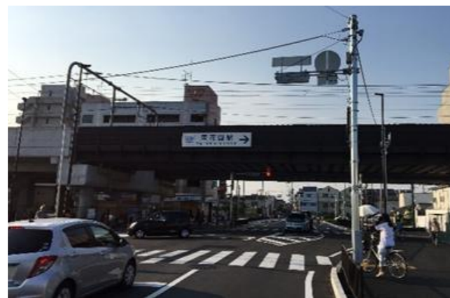
②鉄道高架化後(東花園駅付近)