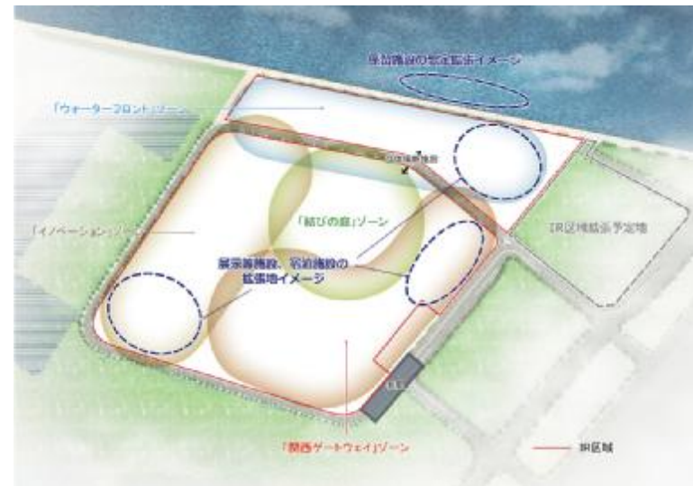
【将来拡張整備のイメージ】 ※現時点での想定イメージであり確定したものではない。