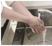
①両手を水で濡らす