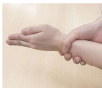
⑧手首もねじるように消毒し、最後に手全体が乾燥するまでこする