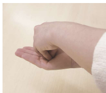
②たまった手指消毒薬に指先をつけて手のひらにこすりつける