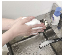
③良く泡立てて手のひらを洗う