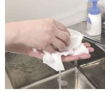
⑩ペーパータオルでたたくようにして水分をとる