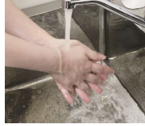
⑨流水で石けんをきれいに洗い流す