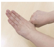
⑦親指を反対の手でねじるように消毒