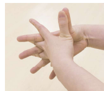
④両手の指の間をこすりつけ消毒