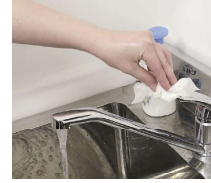
⑪手を拭いたペーパータオルで水道のレバーを押さえ水を止める