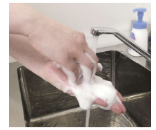
⑥指先を手のひらにこすりつけて洗う