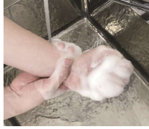
⑧手首もねじるように洗う