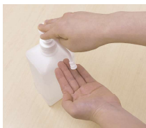
①手指消毒薬を手のひらに取る