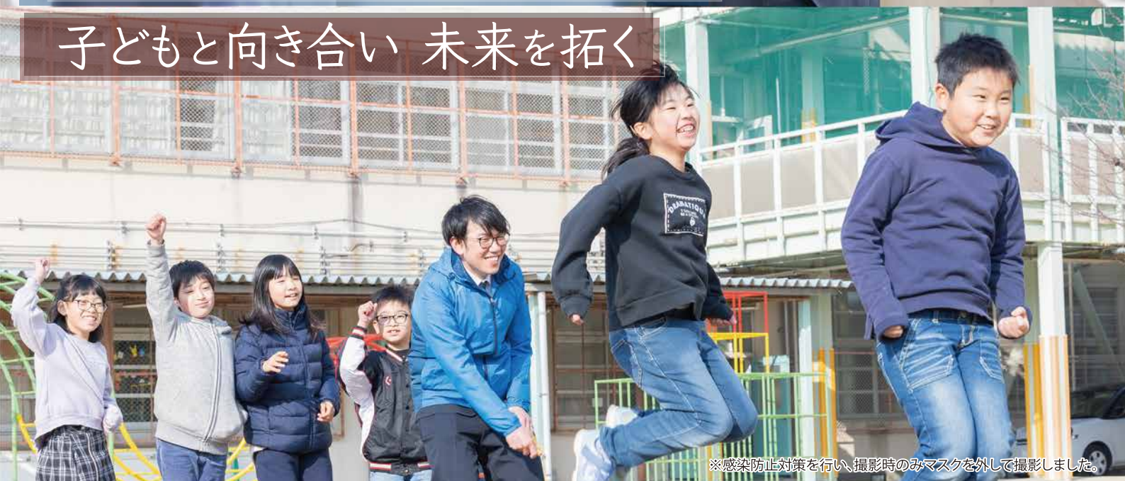
※感染防止対策を行い、撮影時のみマスクを外して撮影しました。