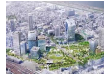
新たなまちの中心となるうめきた2期公園