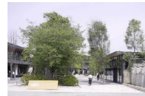
民活による新たな施設設置等による魅力向上