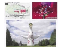
花やイベントなどの情報を府市共通HPなどで発信