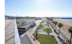
いい・賑わい拠点 りんくろ公園エリア