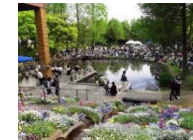
緑を活かした公園の魅力を高めるイベントの実施