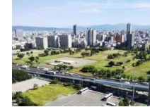
歴史文化観光拠点 難波宮跡公園