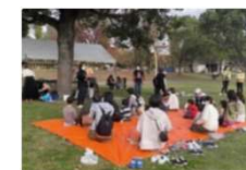
新たな公園の利活用の取組を市から府域全域へ展開