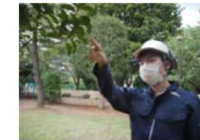
スマートグラスによる業務効率化の検証