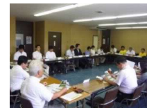
住民・企業等と連携したプラットフォームの設置