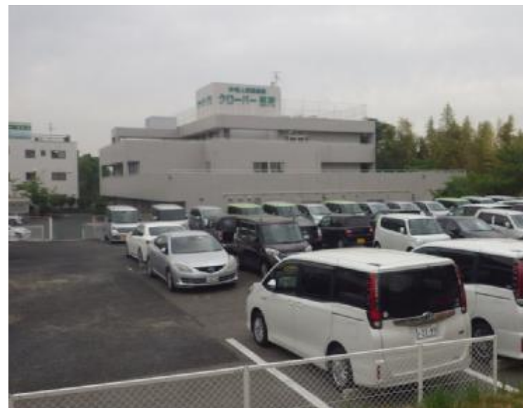
保全対象：要配慮者利用施設