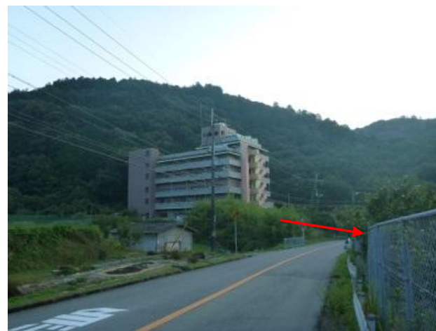
保全対象：老人ホームせんわ