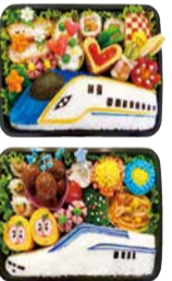
まこつさん作製のお弁当