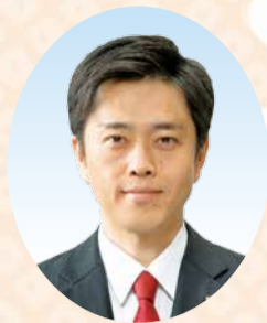
大阪府知事 吉村 洋文

新年を迎え、府民の皆さまにごあいさつ申し上げます。 昨年は、新型コロナウイルス感染症との闘いを続けた1年でした。府民の命と暮らしを守るため、皆さまに多大なご協力をいただきながら、感染拡大の防止と経済活動の維持の両立に全力で取り組んできました。 亡くなられた方々に哀悼の意を表するとともに、療養中の皆さまの一日も早い回復をお祈りいたします。また、医療従事者をはじめ、福祉など私たちの暮らしを支えていただいているエッセンシャルワーカーの方々に、心から感謝を申し上げます。 今年もウイルスとの共存は続きます。1日約2万件をめざした検査体制の充実、大阪コロナ重症センターの運用を含めた医療提供体制のさらなる整備、高齢者施設等でのクラスター対策などをしっかりと進め、感染症対策に万全を期します。