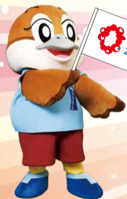
大阪府広報担当副知事 もずやん

万博は、地球規模のさまざまな課題に取り組むために、世界中から英知が集まる場です。日本の成長を持続させる起爆剤として期待される万博を成功に導き、大阪から日本を元気にするためには、府民の皆さん一人一人が万博を盛り上げていくことが大切です。