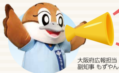
大阪府広報担当副知事 もずやん