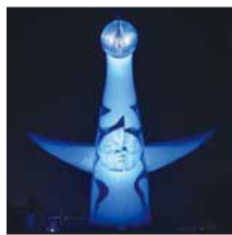
万博記念公園(太陽の塔)

拉致問題の解決のためには、私たち一人一人が関心と認識を深めていくことが大切です。期間中、趣旨に賛同いただいた府内12カ所の施設で、全ての拉致被害者を取り戻すためのシンボル「ブルーリボン」にちなみ、青色にライトアップします。