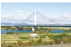
鳥飼仁和寺大橋有料道路

昨今の新型コロナウイルスを踏まえた新しい生活様式への転換の一環として、より一層、自転車を利用していただくために、摂津市と寝屋川市を結ぶ鳥飼仁和寺大橋有料道路の自転車の通行料金を無料にする企画割引を実施します。詳しくは大阪府道路公社のHPをご覧ください。