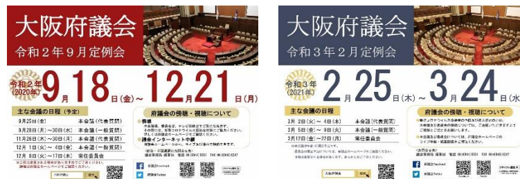
[令和 2 年 9 月定例会]