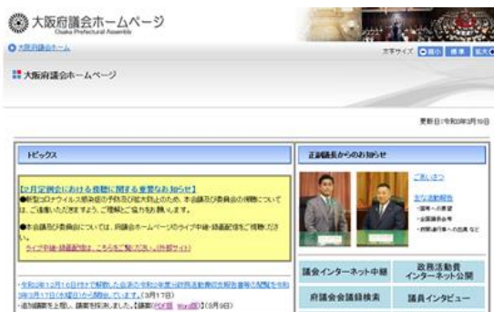
[大阪府議会ホームページ]