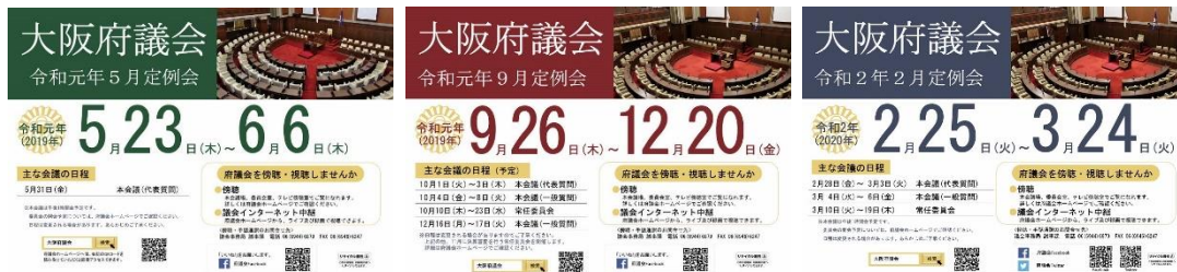
[令和元年 5 月定例会]