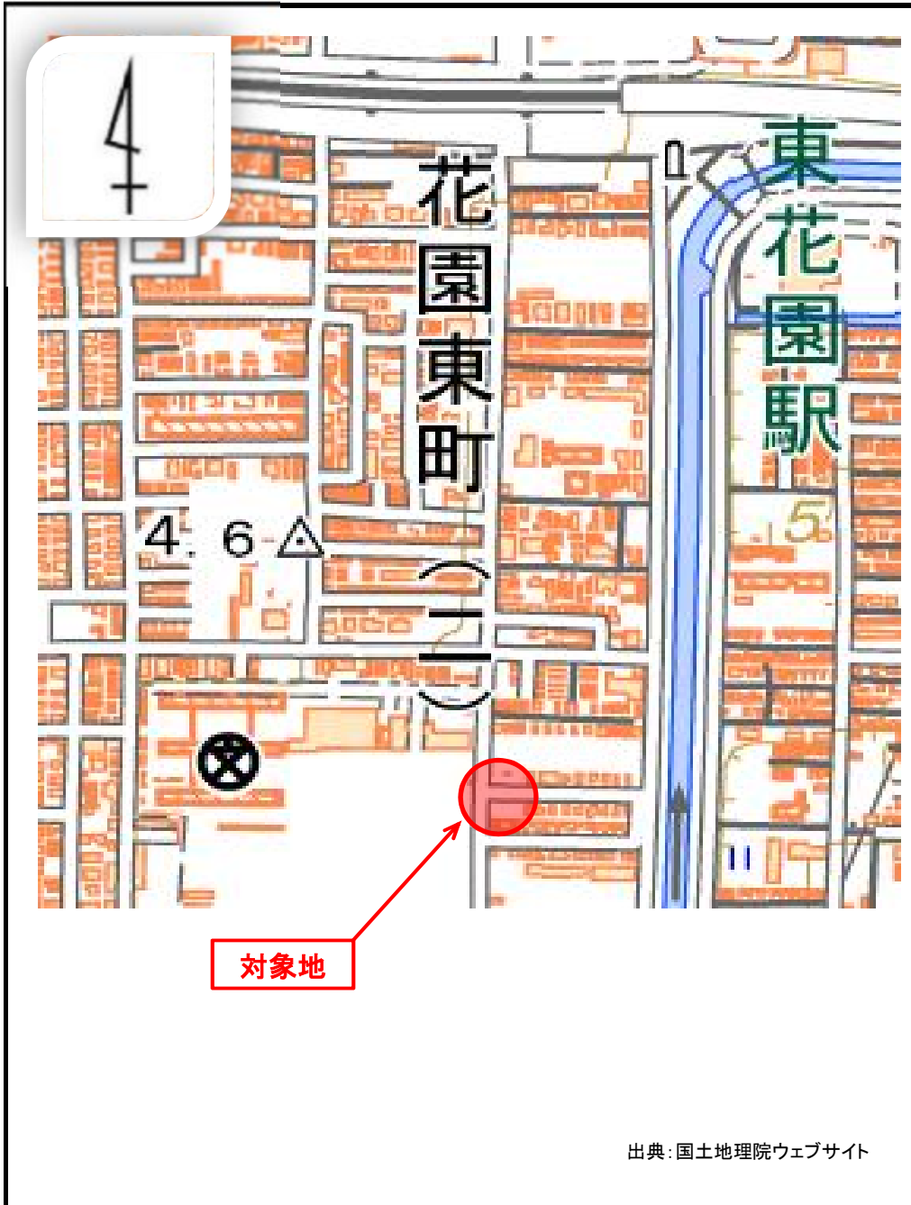
(1)位置図 (物件番号:第1号)