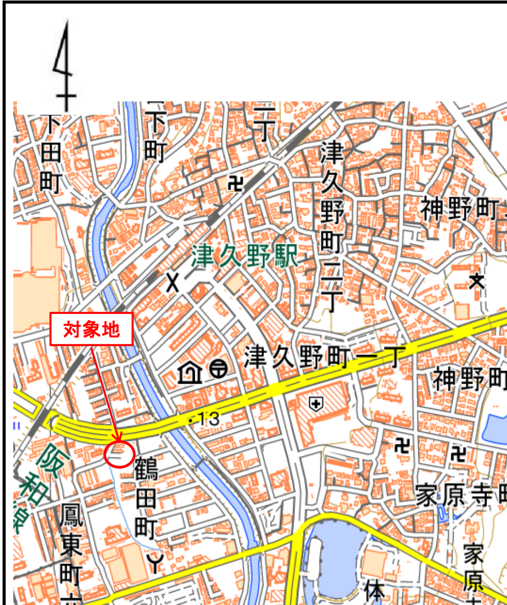
(1)位置図 (物件番号:第1号)