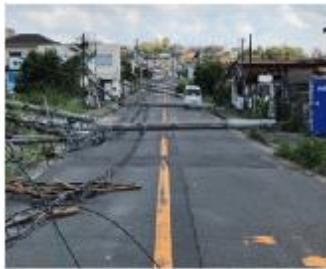
2018年台風第21号による電柱倒壊 (大阪府 泉南市)