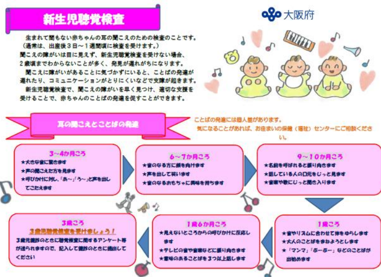
(図 3) リーフレット