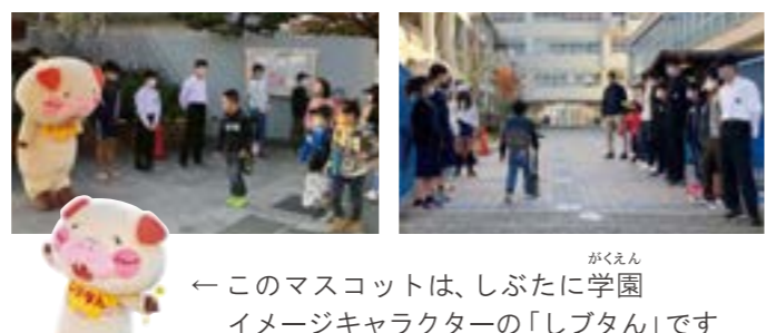
←このマスコットは、しぶたに学園イメージキャラクターの「しぶたん」です