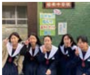
生徒会のみなさん

あいさつの4文字をつかって、生徒会目標をかかげあいさつ運動に取り組んでいます。在校生だけでなく地域の人や登校中の小学生にも元氣いっぱいあいさつし、地域とのつながりを深めています。「自分から」あいさつをすることで、地域の一員であるという自覚が芽生えています。