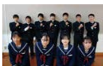
みんなの中心になり伝統エールにとり組む生徒のみなさん

こころは目に見えるものではありませんが、見えないこころを形にしたものが「エール」です。エールは、太子町立中学校で30年以上つづく伝統です。先輩の姿をみて「自分も人前でエールを送りたい」と自分自身を成長させるきっかけとなっています。エールは人のこころを動かし、送られた人に感動を与えています。