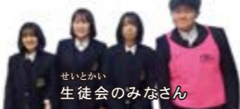
生徒会のみなさん

校庭の木に実った梅を使ったジュースの作り方を地域のひとに毎年教えてもらっています。作った梅ジュースは、体育祭や草刈り大作戦の日に参加者の方にふるまっております。また、地域の人と一緒に校庭の畑や田んぼ、花壇で季節の植物や野菜を育てています。育てた植物は生徒会のイベントに活用したり、近くのこども園にプレゼントしたりしています。地域の中で子どもたちのこころが育まれています。