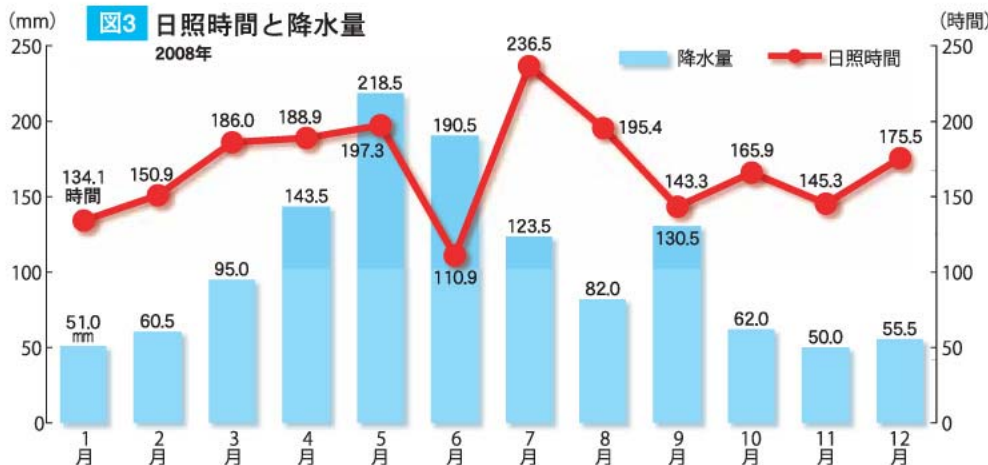
図3 日照時間と降水量 2008年