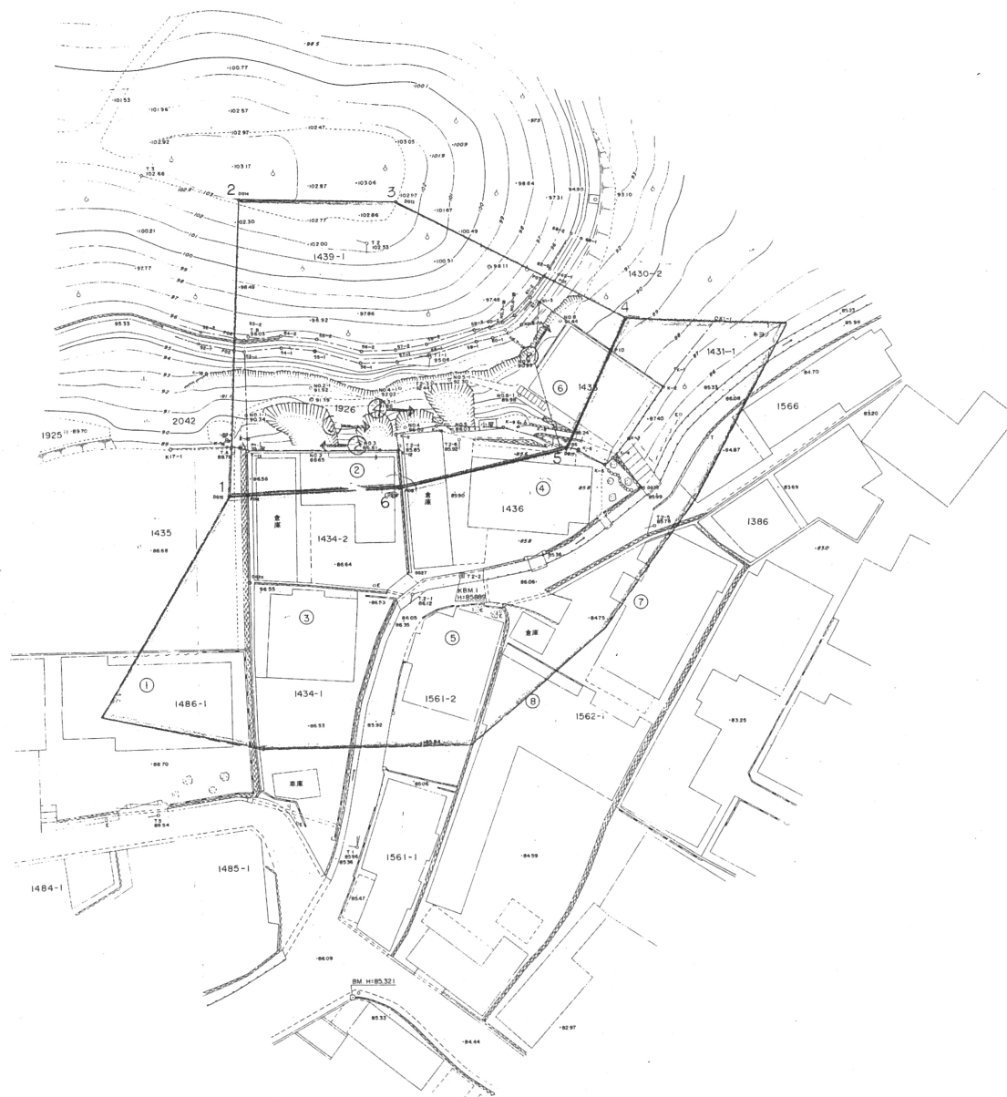
奥ノ池(2)地区急傾斜地平面図 S=1:250