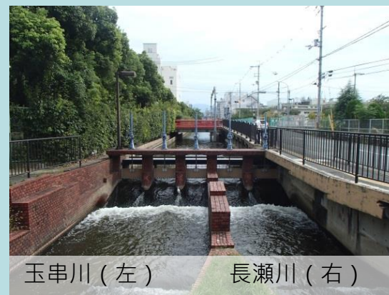
玉串川(左) 長瀬川(右)