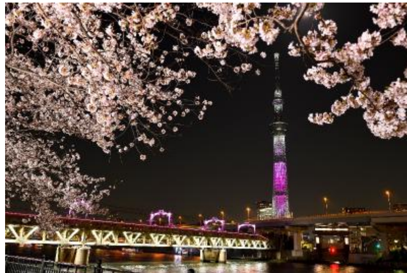
隅田川のライトアップ