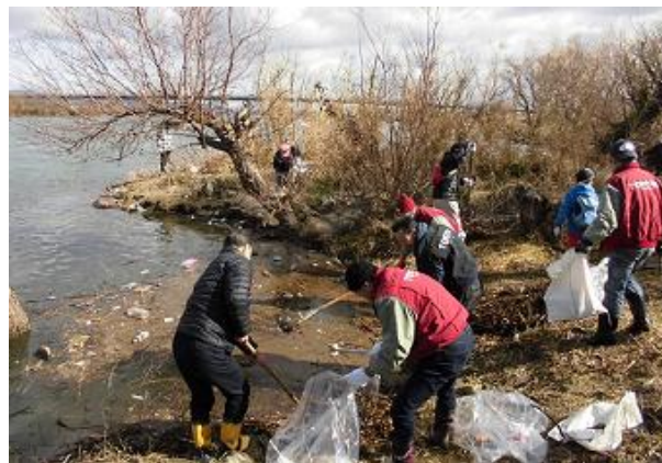
企業による清掃活動