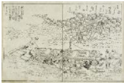
都名所図会 淀（国際日本文化研究センター）