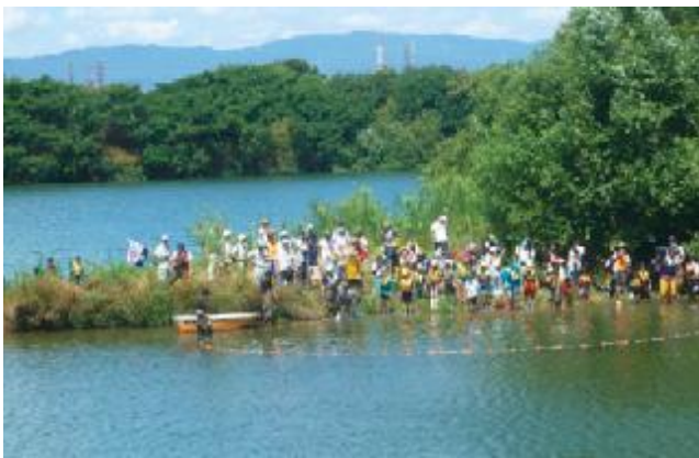
地域団体による自然体験学習