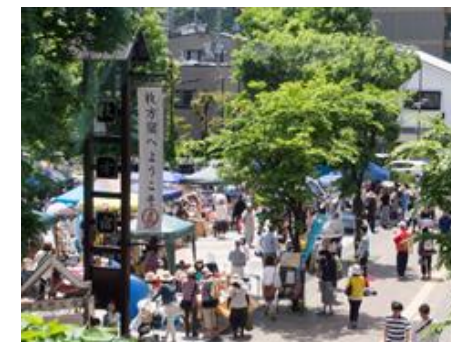
くらわんか五六市