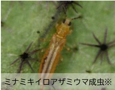
ミナミキイロアザミウマ成虫※