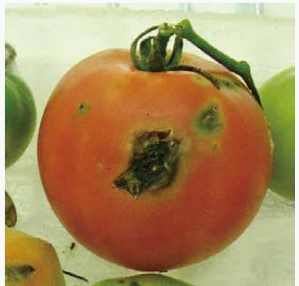
図4 トマト果実の被害