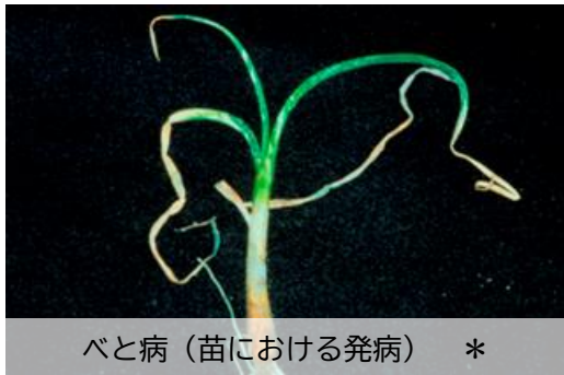
べと病（苗における発病） *