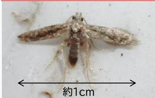
図1 府内で誘殺された成虫