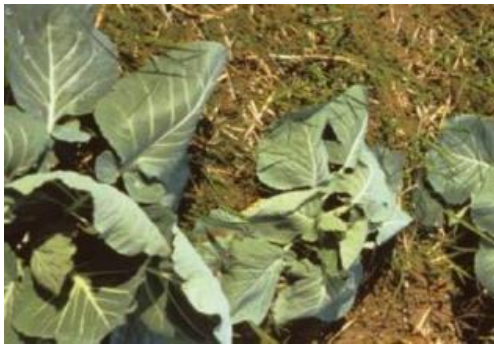
キャベツのしおれ症状と生育不良*