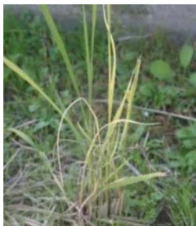
縞葉枯病(ひこばえでの病徴)