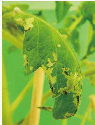
図3 トマト葉の被害