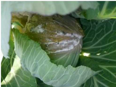
キャベツでの発生