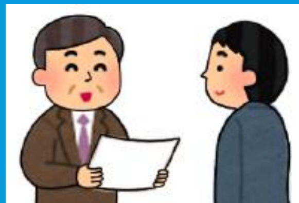
②【責任者（総責等）の選任】

業務の管理を行う上で 必要な能力及び経験 を 有する者を 責任者 として 選任 すること