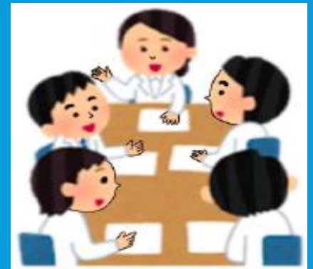
③ 【責任者の意見の尊重】

許可等業者は、 責任者の意見を尊重 し、法令遵守のための必要な措置を講じなければならない