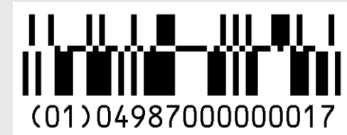
GS1データバー 二層型