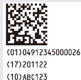
GS1データマトリックス