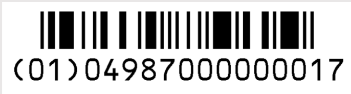
GS1データバー 限定型