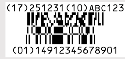
GS1データバー 二層型 合成シンボル CC-A