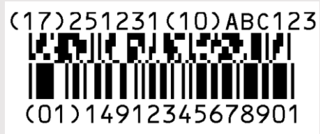
GS1データバー 限定型 合成シンボル CC-A