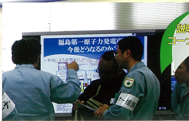
原子力や 放射線に ついて わかりやすく ご説明