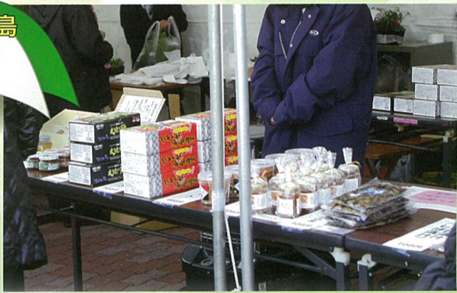
若狭・福島 名産が勢揃い