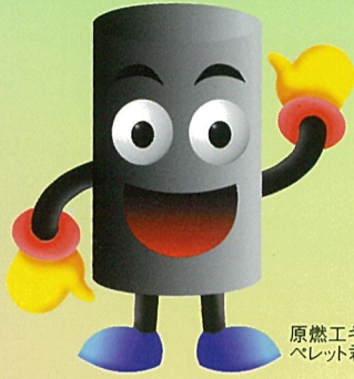
原燃工キャラクター ペレット君

“げんねんこう”は原子力発電所の燃料を製造しています。この機会にぜひご見学ください。