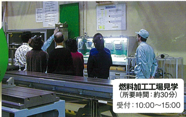
燃料加工工場見学 (所要時間:約30分) 受付:10:00~15:00