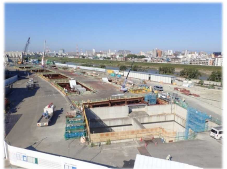
上空からの現場状況 ▶