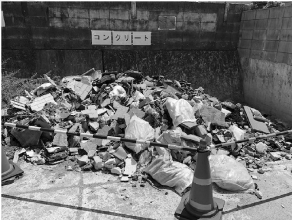
道路公園管理資材倉庫仮置場