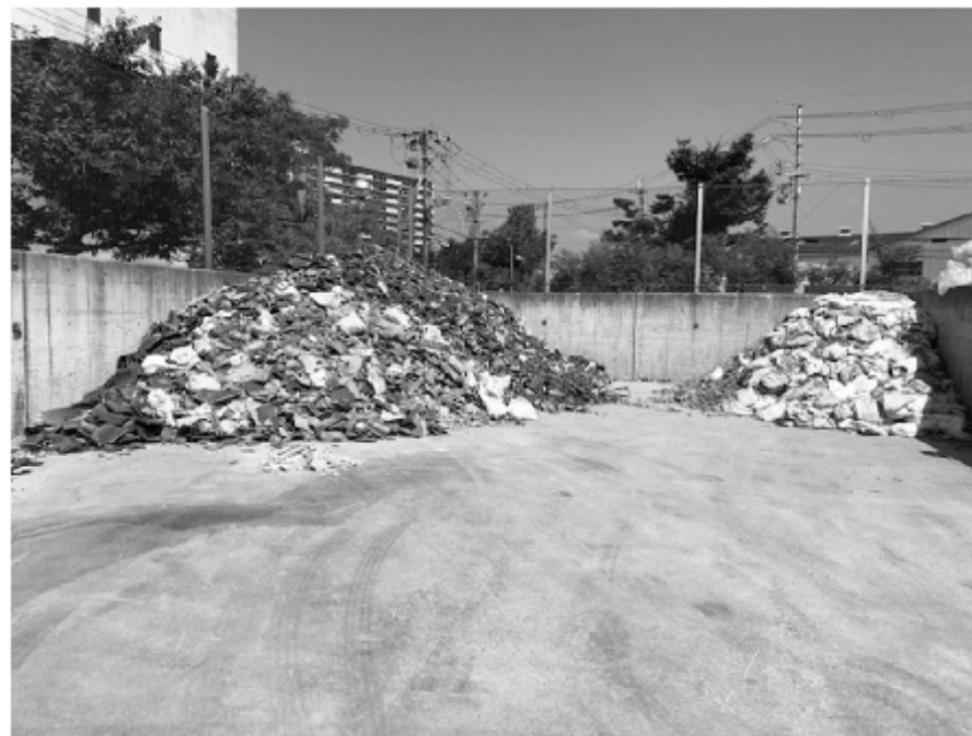
クリーンセンター内ストックヤード仮置場