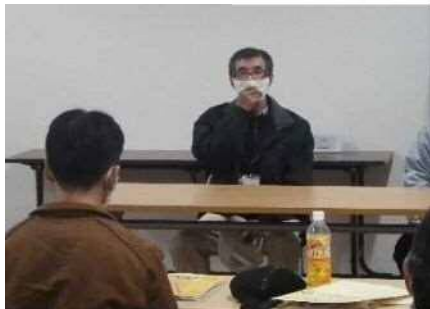
講習会で受講者に体験談を話すAさん