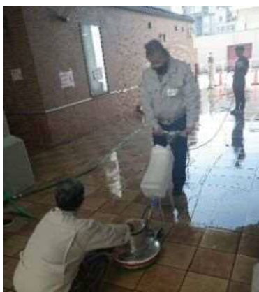
きっかけとなった講習の様子 (※写真は前回の講習会)

体調が回復したので、また仕事したいと悩んでいたところに、センターで清掃業務体験講習があると知り、よいきっかけになればと受講しました。講習を受けた後は、仕事を見つけて清掃の仕事をしています。