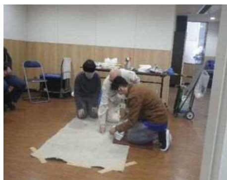
講習会でしみぬきを先生に教えてもらっている様子

講習をきっかけに今の仕事にすることができたので、自分の経験をほかの受講者に語る役割もさせてもらっています。自分の経験を聞いてもらって清掃業の仕事をしてくれる人が出てきたらうれしいです。