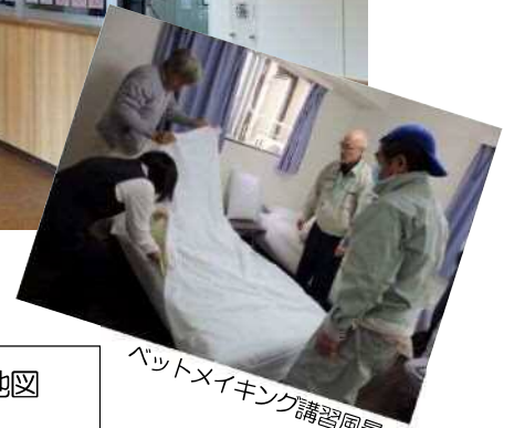
ベットメイキング講習風景