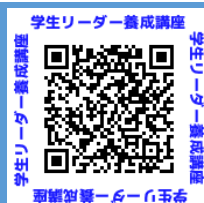
学生リーダー養成講座

大阪府では、SDGsの推進を図り、SDGs先進都市をめざしています。本事業は、SDGsに掲げる17のゴールのうち、「12つくる責任つかう責任」のゴール達成に寄与するものです。