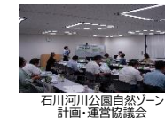
石川河川公園自然ゾーン計画・運営協議会