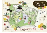
泉佐野丘陵緑地コートまっぴ