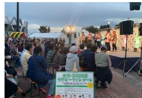
(ステージイベント)