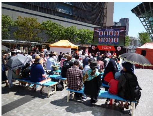
6/12パブリックビューイング@うめきた広場 開催都市PRブース

【連携内容】 大阪文化芸術フェス、メトロック2018等の文化イベントでのPRチラシの配布 うめきたアウトドアフェスタ、TOTOリモデルフェア等大会オフィシャルスポンサーとの共同PRブース設置 ジュピターテレコム (J:COM) 主催のラグビー日本代表戦でのパブリックビューイングにおける開催都市PRブースの設置