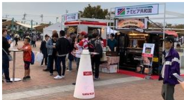
(出場国キッチンカー)