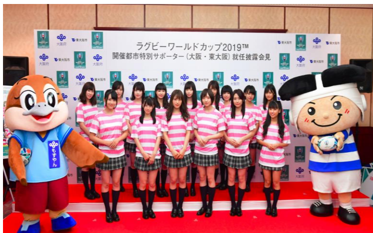
(開催都市特別サポーター就任披露会見)

大会開催1年前を機に、大阪を拠点として活動しているNMB48のみなさんを開催都市特別サポーターに任命。就任披露会見を実施。