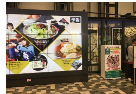
(あべのハルカス近鉄本店)