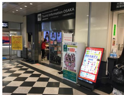
(JR大阪駅 おもてなしステーション)