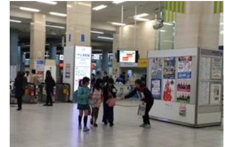
(大阪上本町駅改札口)