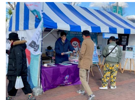
全国高校ラグビー@花園ラグビー場前