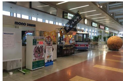
(大阪モノレール万博記念公園駅)