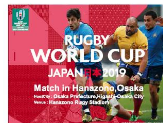
(例：近鉄東花園駅フロアシート)