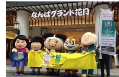
(「なんばグランド花月」エントランス前)