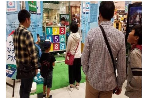
(ストラックアウト)