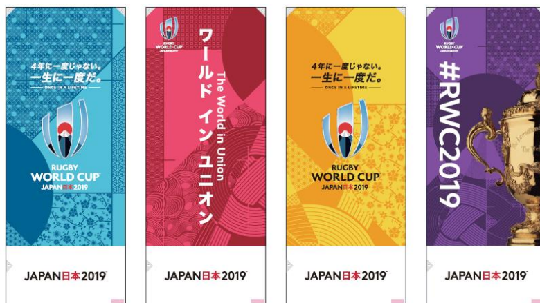
街灯バナー（イメージ）