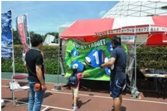
ラグビーアクティビティ（イメージ）