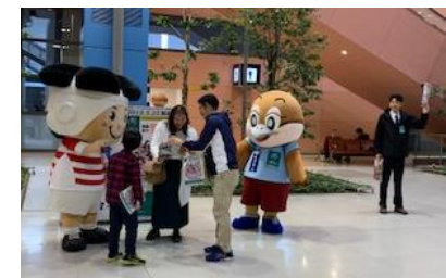
(関西国際空港ロビー)