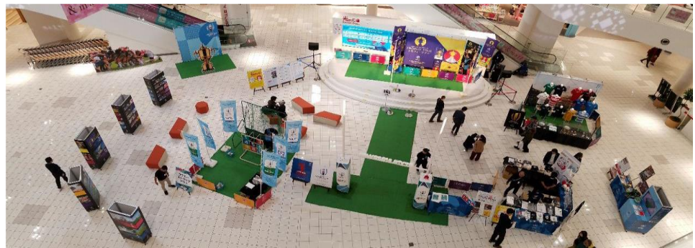
(ポップアップミュージアム全体風景)