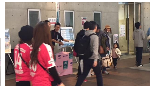
Jリーグ@ヤンマースタジアム長居