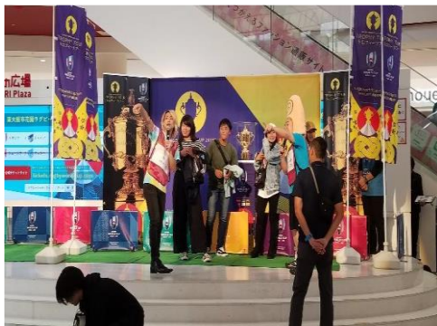
(ウェブ・エリス・カップとの記念撮影)