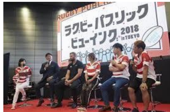
パブリックビューイング（イメージ）