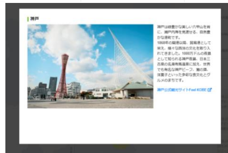
(神戸市など、近隣県情報)