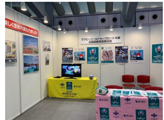
1/26・27リモデルフェア@ATCホール TOTO共同PRブース