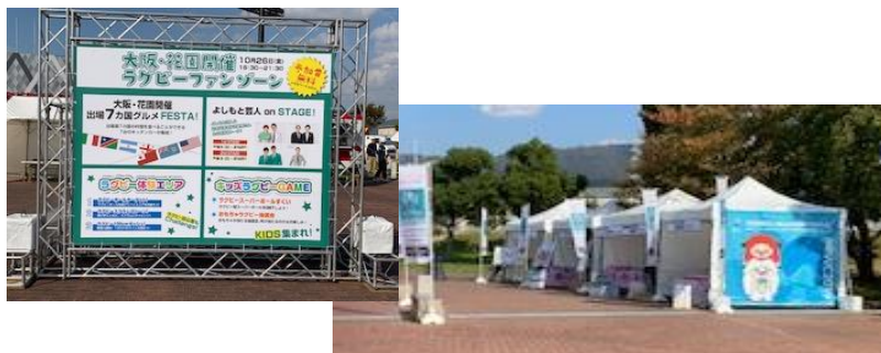
(ラグビーファンゾーン入口)