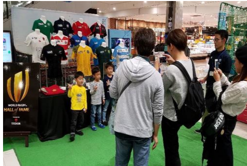
(ユニフォーム記念撮影)

RWCの優勝トロフィー「ウェブ・エリス・カップ」の開催都市巡回に合わせて、トロフィー展示とRWC、ラグビーの情報を提供する「ポップアップミュージアム」を実施。マスコットキャラクターであるレンジーも登場し、記念撮影に応じるなど、買い物客等へ広報PR活動を展開。