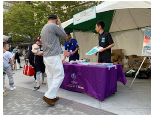
10/13・14アウトドアフェスタ @うめきた広場 三菱地所(株)共同PRブース