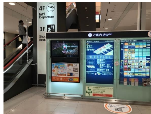
(K I X インフォメーションボード)