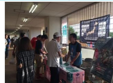
トップリーグ@万博記念競技場

【連携内容】大阪府ラグビーフットボール協会等と連携し、会場内でRWC2019PRブースを設置。