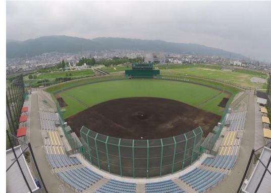
「花園中央公園野球場」