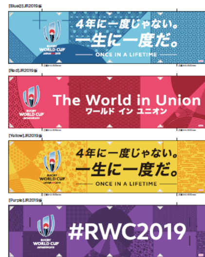
多目的バナー（イメージ）