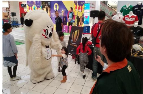
(レンジーとの記念撮影)